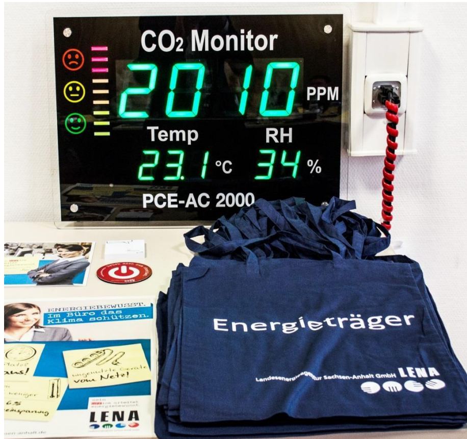
Materiales para multiplicadores de energía