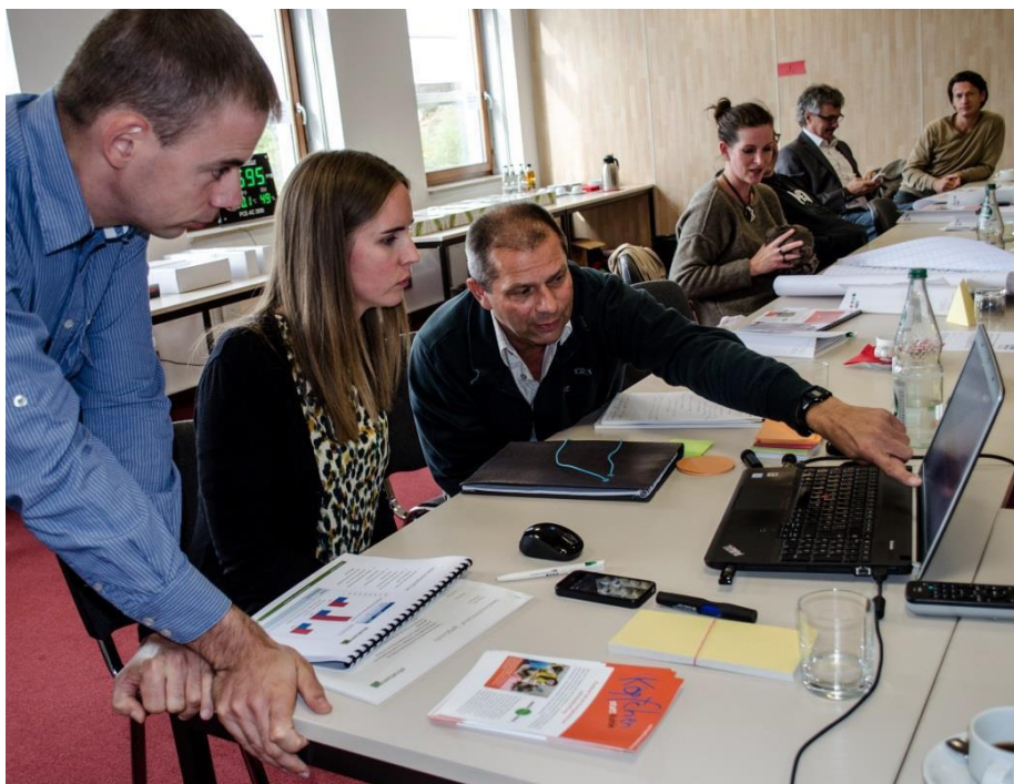
Taller de impresiones 2