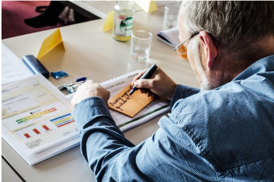
Taller de impresiones 01